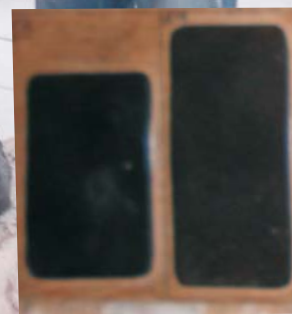
Patines vertes pour visage et mains