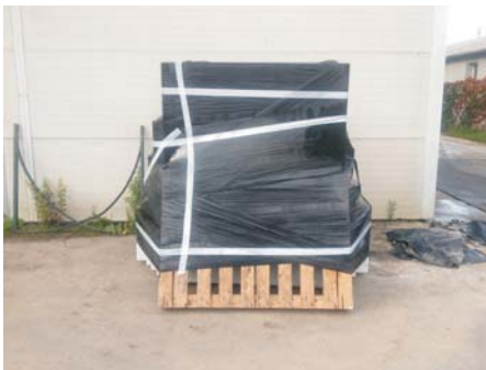
Stockage du socle le 22 11 12 aux services techniques d'Ajaccio

La pose devra se faire avec un véhicule de manutention avec Flèche de portance de plus de 2.5 tonnes .